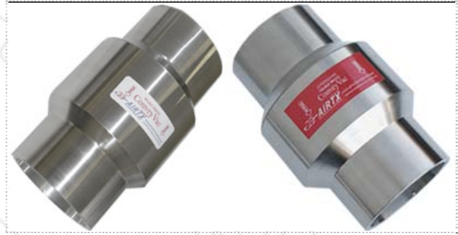
普通型气力输送器尺寸